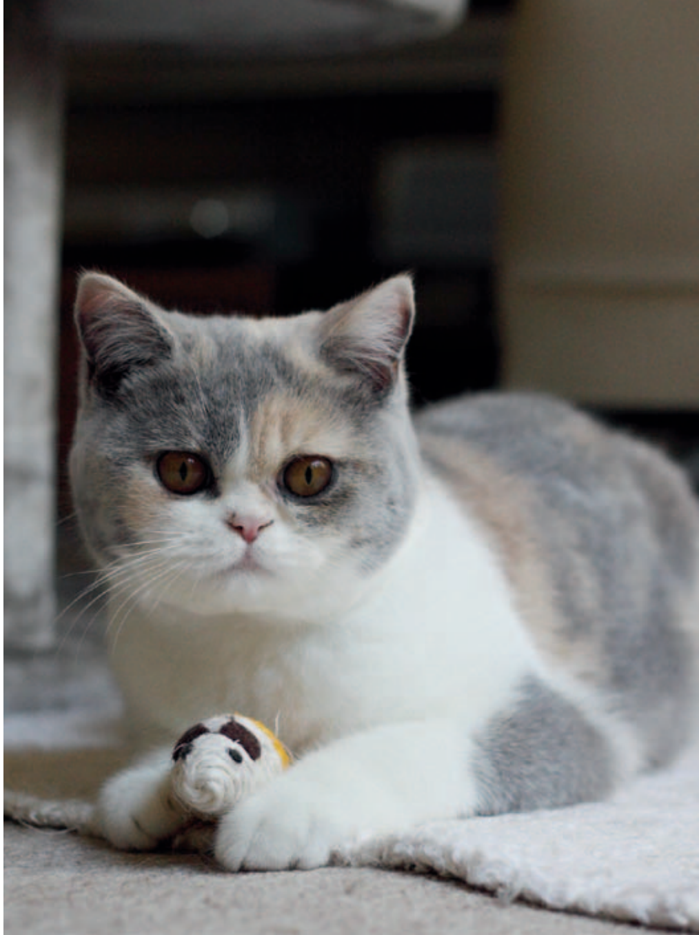
Najmladšia posila našej chovateľskej stanice z Nemecka – China Rose v. Loderberg DE v netradične kombinovanom korytnačinovom sfarbení s bielou

Naša chovateľská stanica Endless Infinity *SK sa venuje chovu britských mačiek vo farbách čierna, čokoládová, červená, krémová a korytnačinová, tiež v kombináciách s bielou, výhradne s preukazom o pôvode. Z chovateľského pohľadu priniesla do našej chovateľskej stanice veľmi cenný genetický potenciál mačka importovaná z Holandska menom Kalamazzoo de la Boucharelle vo farebnej variete modrá korytnačinová. Aj napriek tomu, že Kalamazzoo má dnes vek takmer 10 rokov, stále predstavuje aktuálny typ britskej krátkosrstej mačky. Po zrelej úvahe sme sa rozhodli, že v chove budeme pracovať s jej