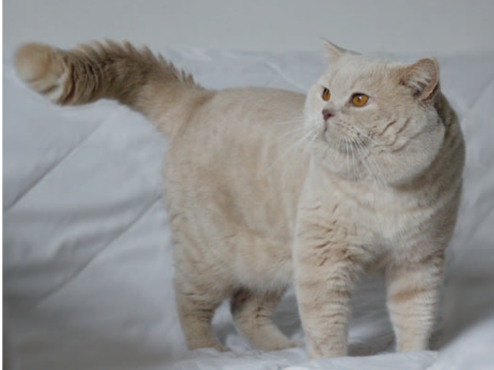
GIC Merlin Nimble Cat CZ. Tento kocúr je pre chovateľku stelesnením predstáv o britskej krátkosrstej mačke nielen kvôli typu, ale aj jedinečnosti pôvodu

Je potrebné napísať, že určité plemeno mačiek si od chovateľa kúpite len s preukazom o pôvode (PP). Bez preukazu o pôvode v žiadnom prípade nemožeme hovoriť o plemene. Mačiatko bez PP je